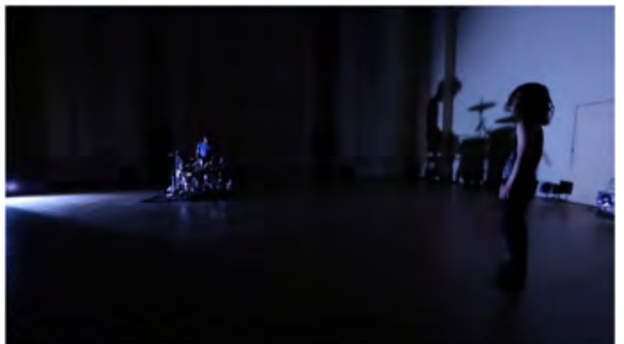
Illustration couverture : JB Geoffroy